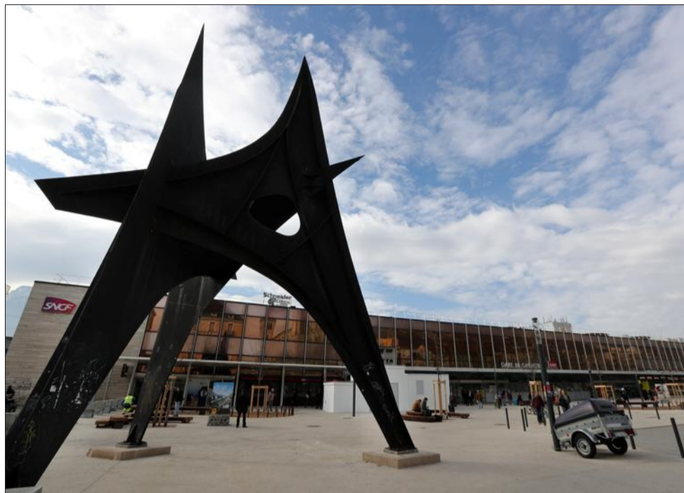
Le Calder trône désormais au milieu d'un nouveau parvis de la gare doté de 25 arbres, de 4 îlots de jardin et de bancs arrondis en bois.

La gare est désormais la plaque tournante de la mobilité, où se côtoient le TER, le TGV, le tram, le car, le taxi, l'auto-partage et le vélo. Au même endroit, il est possible d'acheter son billet TER, LER, Transisère, Tag et navettes aéroports.