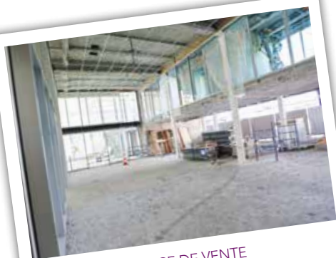
ESPACE DE VENTE MULTIMODAL En travaux - septembre 2015