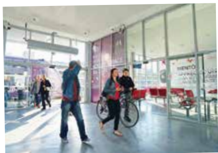
UN NOUVEL ESPACE EN GARE CÔTÉ EUROPOLE Mis en service - septembre 2015