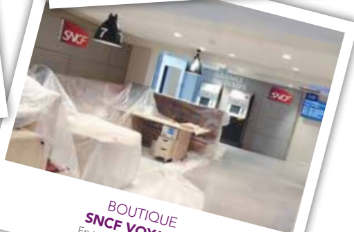
BOUTIQUE SNCF VOYAGES En travaux - octobre 2015