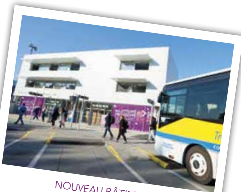
NOUVEAU BÂTIMENT DE LA GARE ROUTIÈRE Mis en service - juillet 2015