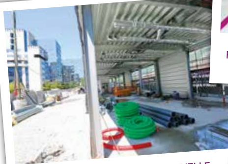
CONSTRUCTION DE LA NOUVELLE ENTRÉE GARE CÔTÉ EUROPOLE mai 2015