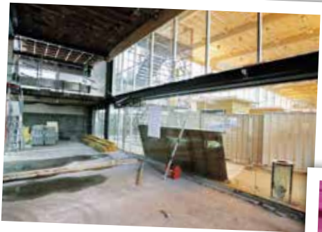
ESPACE DE VENTE MULTIMODAL mai 2015