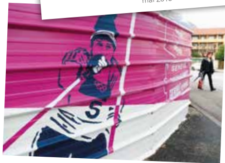
FRESQUE SUR LA BASE VIE DU CHANTIER mars 2015