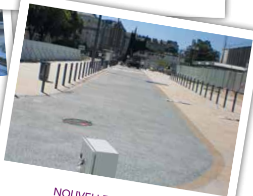
NOUVELLE VOIE TAXIS mai 2015