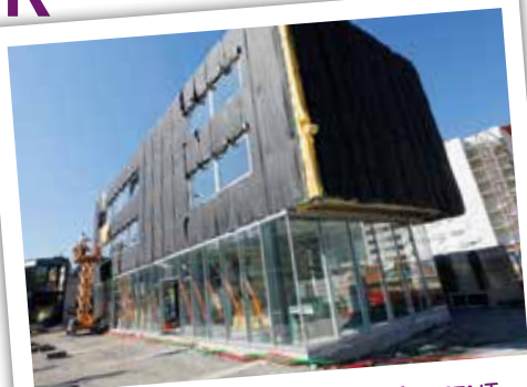
RÉALISATION DU NOUVEAU BÂTIMENT DE LA GARE ROUTIÈRE mai 2015